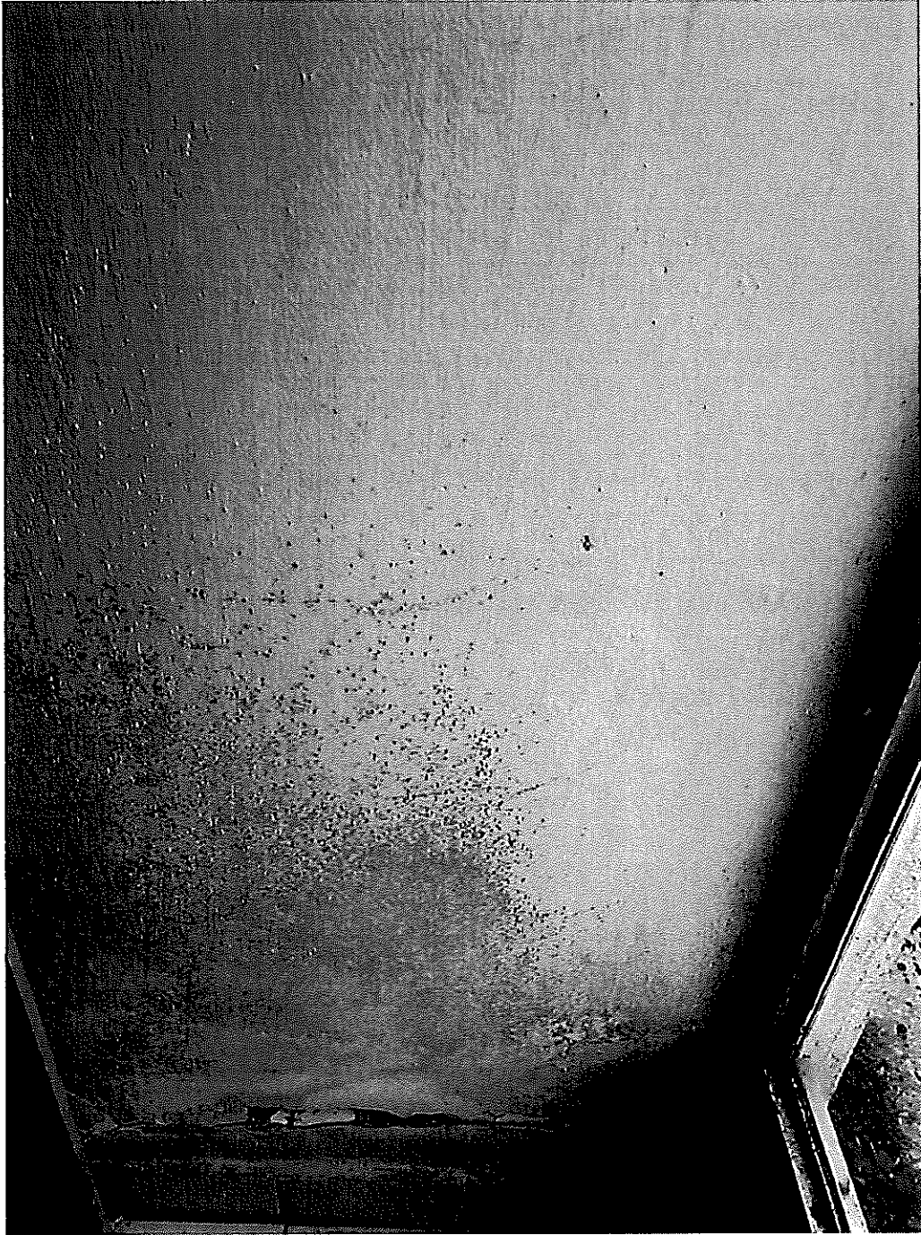
A penész többszöri eltávolítás után is megjelenik a körülmények miatt. A járólapp felett a vakolat repedezik, omlik.